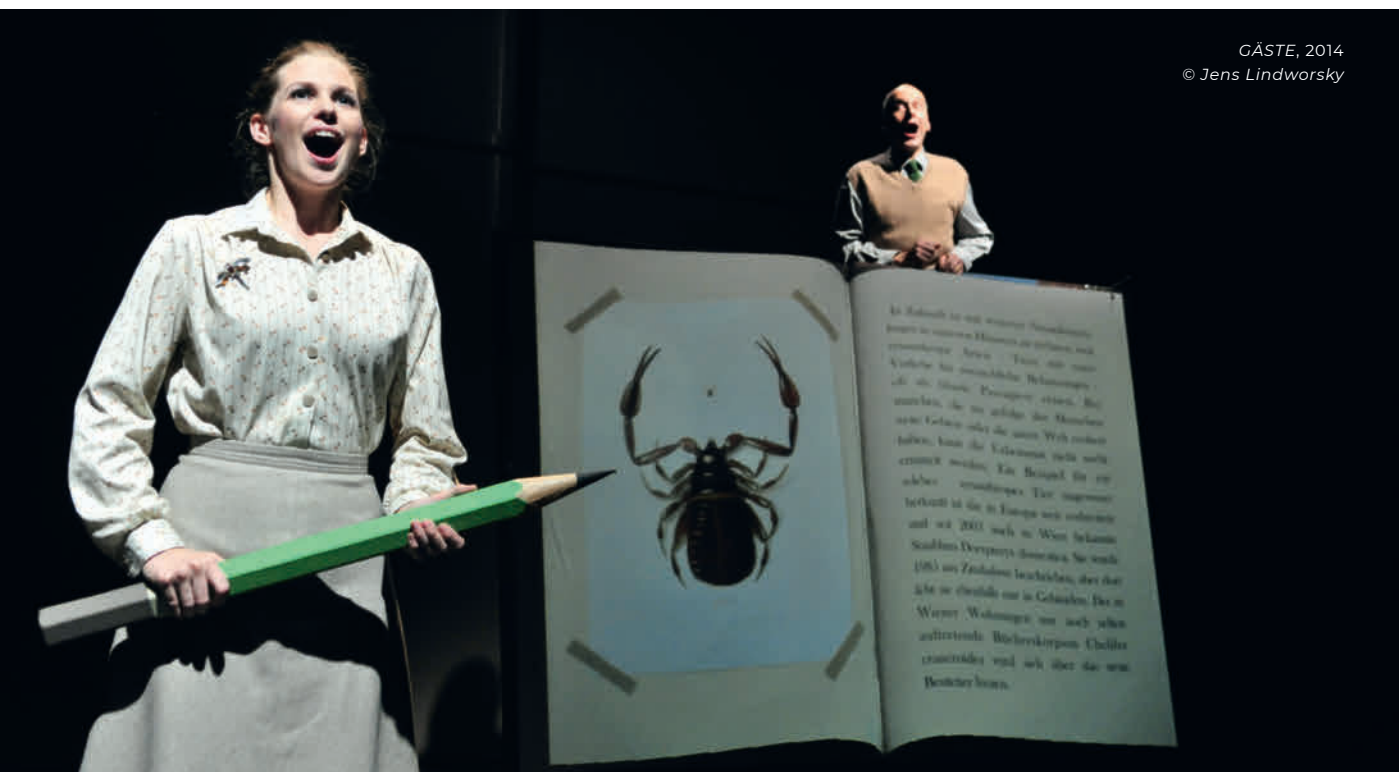
GÄSTE, 2014 © Jens Lindworsky