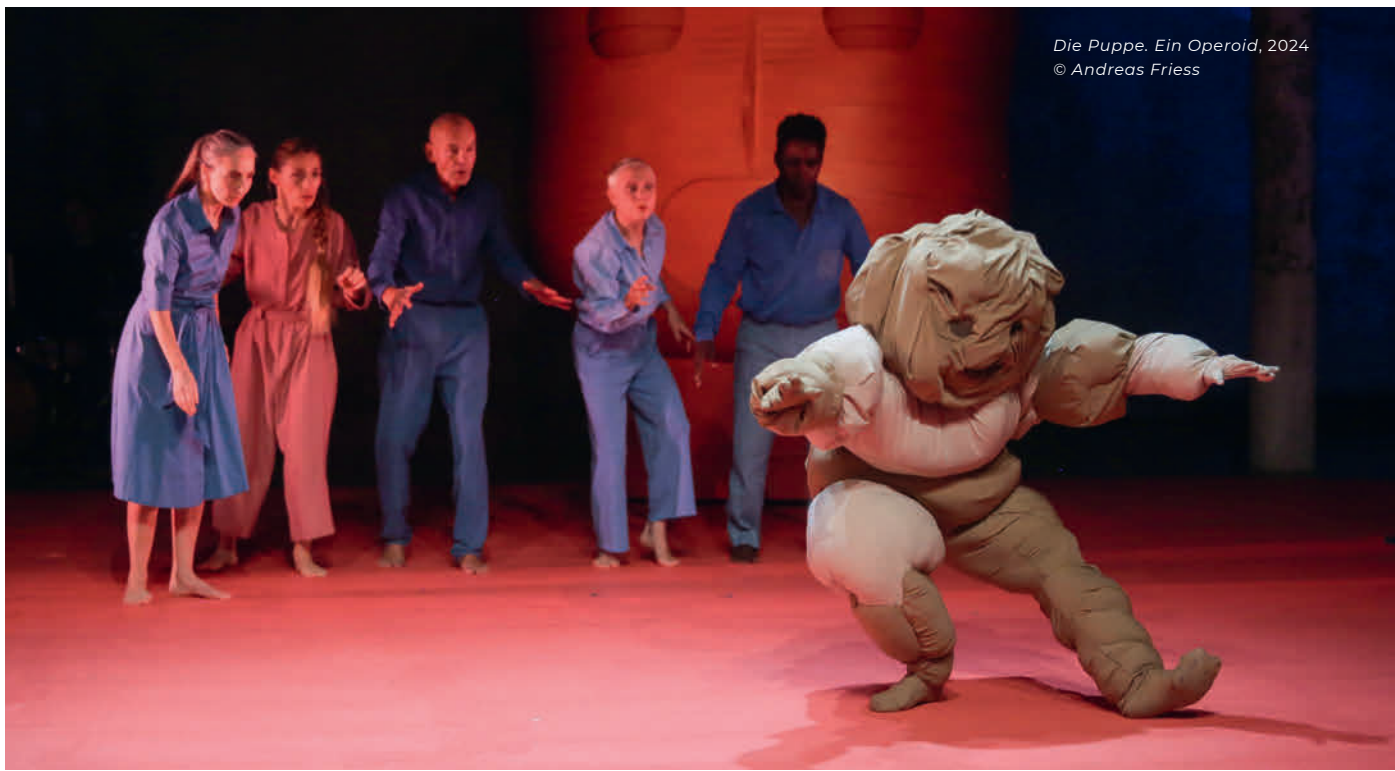
Die Puppe. Ein Operoid, 2024

Everhartz: „Wir haben versucht Formate zu finden, die den Leuten Spaß machen. Das erste dieser