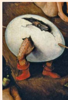
Hieronymus Bosch, Weltgerichtsalter, Detail

Gemäldegalerie der Akademie der bildenden Künste lädt ein: »Meisterwerke der europäischen Malerei« Mit Hieronymus Bosch, Tizian und Rubens. Dienstag bis Sonntag, 10-18 Uhr, Führungen auf Anfrage. Gemäldegalerie der Akademie der bildenden Künste Wien, 1., Schillerplatz 3 , T: 01/588 16-225, www.akademiegalerie.at