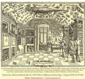
Flyerabbildung: © Michael Bachhofer, Kupferstich

Donnerstag 7.8.25 - 19h Kaiserwühlengasse 14 1220 Wien