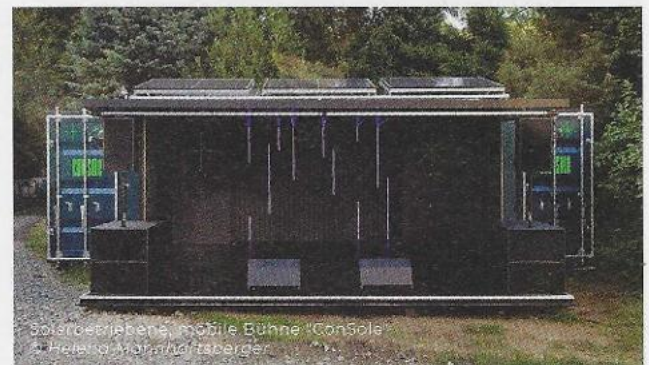
goldverliebte, mobile Bühne "Console"

Einen Baustellenalltag gibt es nicht – jeder, oder fast jeder Arbeitstag sieht anders aus! Aus diesem Grund werfen wir Schlaglichter auf einzelne Projekte und Arbeitsabläufe, um die Bandbreite unserer Tätigkeiten zu erfassen: