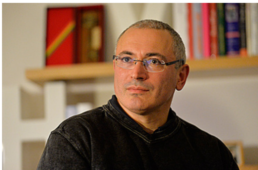
Michail Chodorkowski.